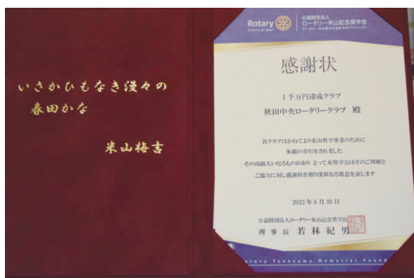
ロータリー米山記念奨学会感謝状 "1千万円達成クラブ、