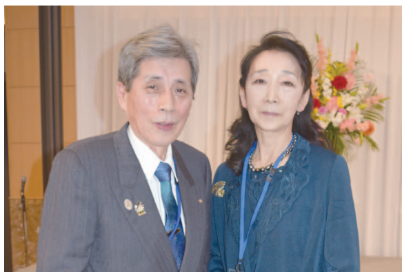
松浦PGおめでとうございます "80歳長寿ロータリアン、