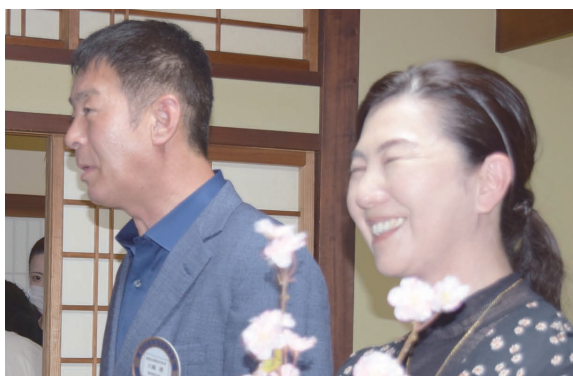
親睦委員会緊張のごあいさつ